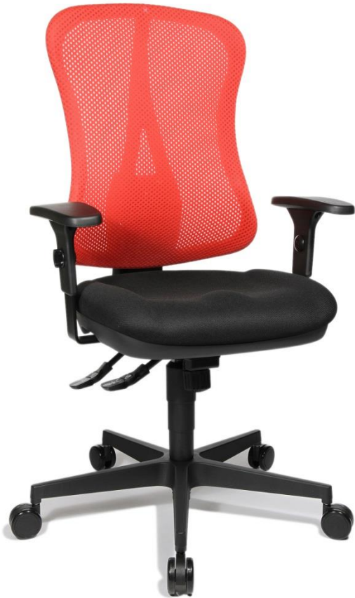
Abb. in Ausführung HE20P BC01